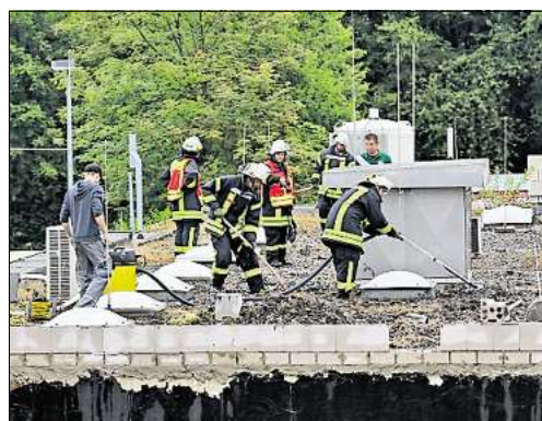
Feuerwehrleute saugen auf dem Flachdach das Wasser ab. In dem Gebäude ist die Energieversorgung des Krankenhauses untergebracht. CAP

In allen Räumen tropfte das Wasser von der Decke auf die Schaltschränke. Feuerwehrleute