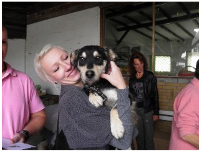
Propeller/ Elmo :)