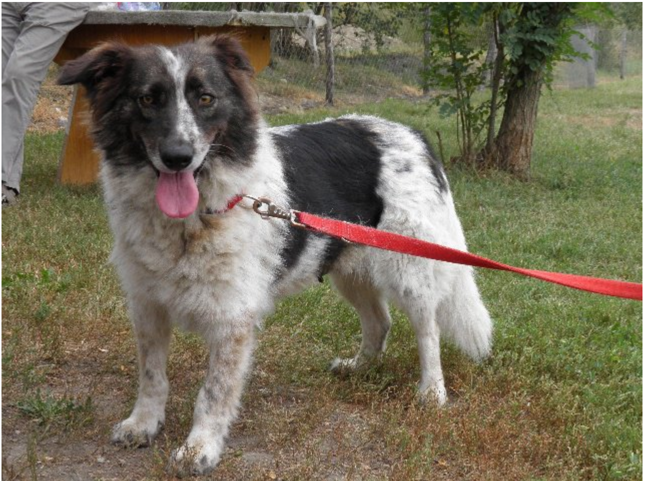
Nancy, die inzwischen viel zutraulicher und weniger ängstlich geworden ist.